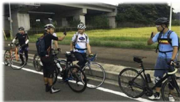
いばらきサイクリングサポートライダー養成講座の実装講習