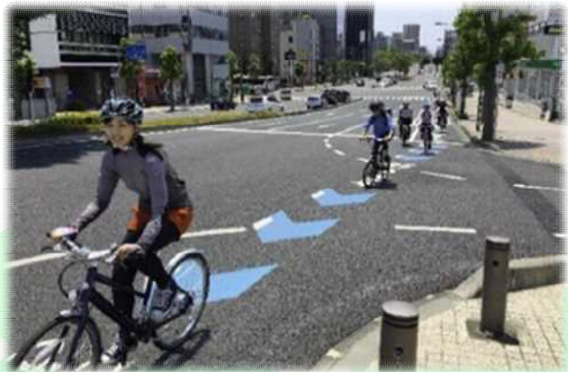
自転車通行空間の整備