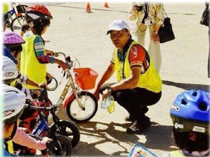
未就学児への安全教育