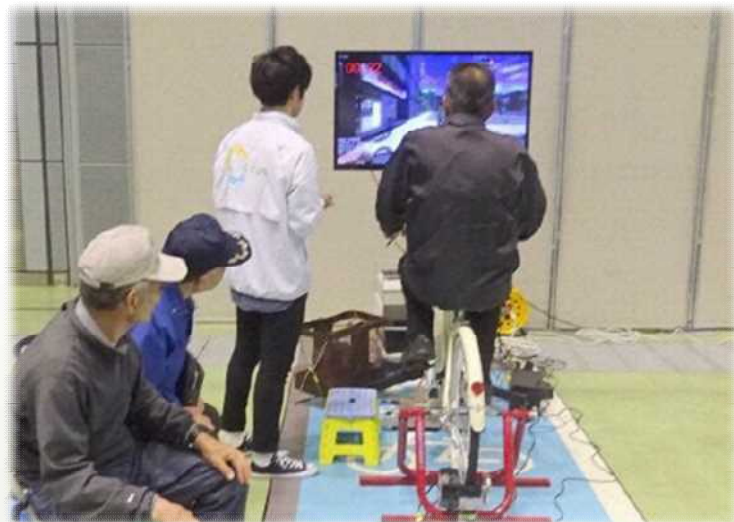
自転車シミュレータによる 安全教育の例