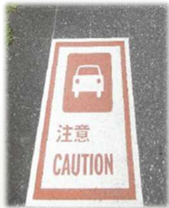
注意喚起 サインの例