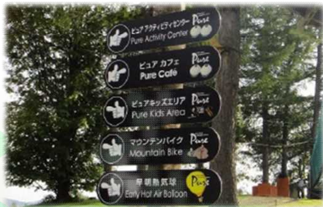
多言語とピクトグラムを使用したサインの例