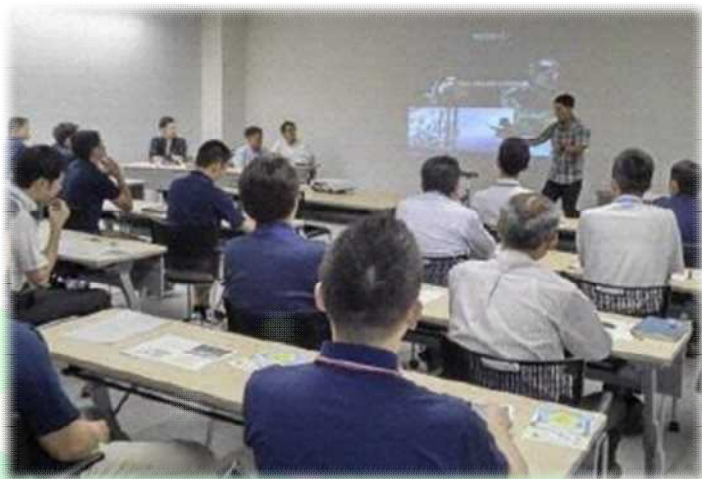
自転車通勤体験プログラム講習会