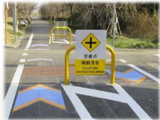
矢羽根・交通安全の 施策の例