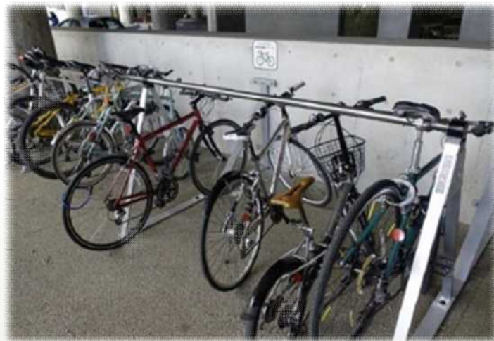
茨城県庁舎の駐輪場