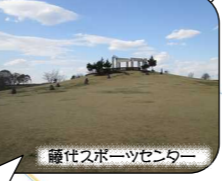
藤代スポーツセンター