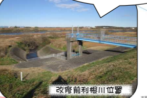
改修前利根川位置