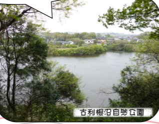
古利根沼自然公園