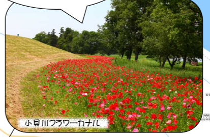
小見川フラワーカナル