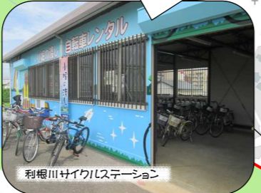
利根川サイクリステーション

ここで自転車を借りて スタート！貸出期間は 3月20日～11月30日 までの土日祝。9時～16時。