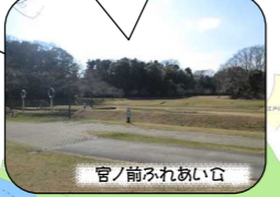
官ノ前ふれあい広

ここで自転車を借りて スタート！貸出期間は 3月20日～11月30日 までの土日祝。9時～16時。