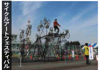
サイクルアートフェスティバル