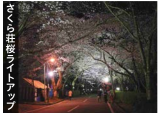
さくら荘桜ライトアップ