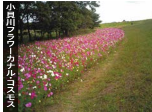
小貝川フラワー・カナルコスモス