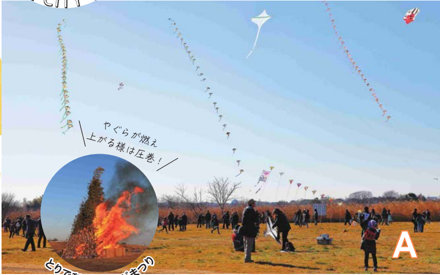
とりで利根川どんどまわりの