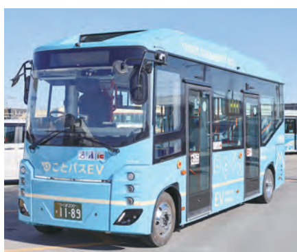
西部ルートのバス写真(EVバス)