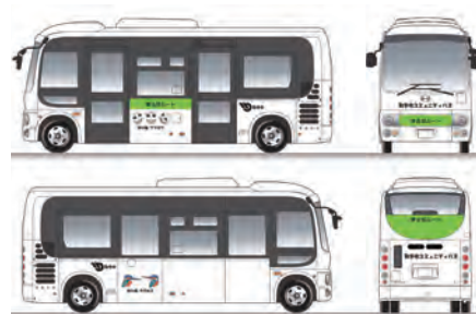
東北部ルートのバスイメージ