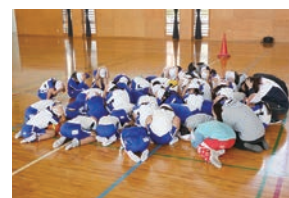
過去に行われた シェイクアウト訓練

その時にいる場所で身を守る安全確保行動「まず低く、頭を守り、動かない」を行います。