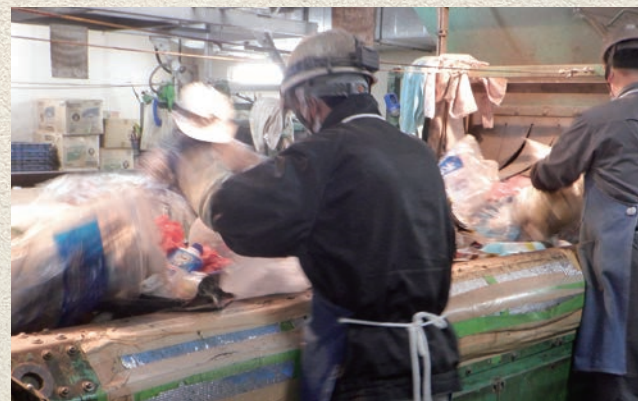
搬入されたごみを、手で選別し仕分けする職員