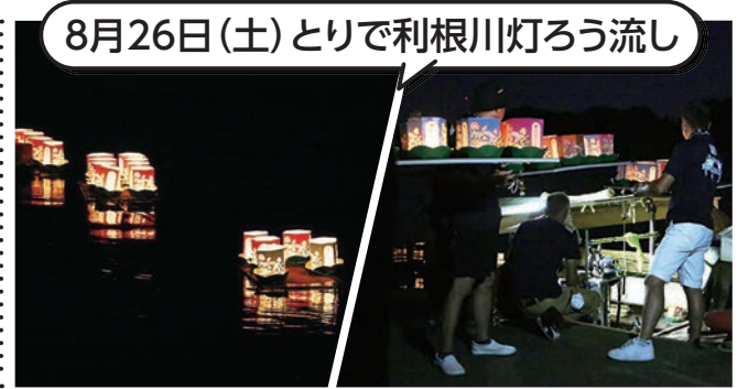
8月26日(土)とりで利根川灯ろう流し