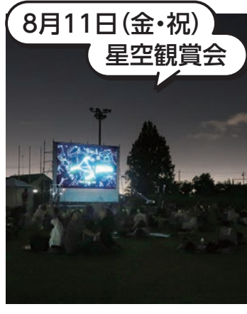
8月11日(金・祝) 星空観賞会