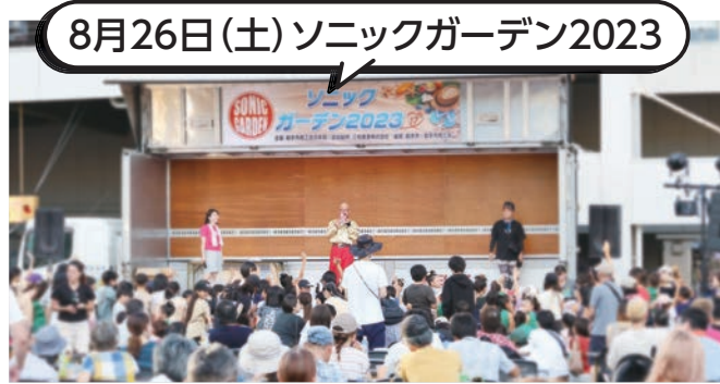
8月26日(土)ソニックガーデン2023