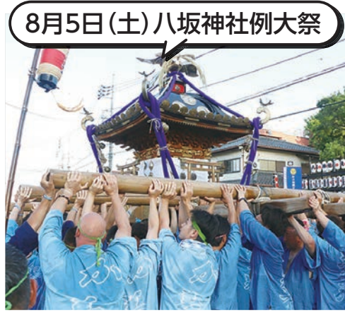
8月5日(土)八坂神社例大祭