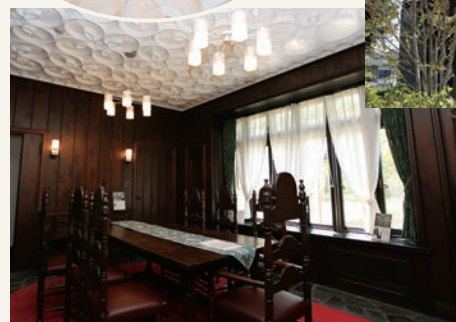
▲漆喰で立体的な装飾が天井に施された食堂(1階)